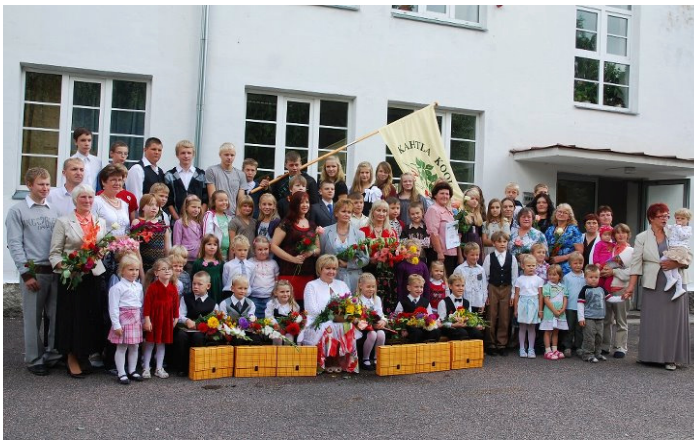
Kahtla Lasteaed – Põhikooli pere 01. septembril 2011

TEGUSAT JA HUVITAVAT 2011/2012 ÕPPEAASTAT KOGU KOOLIPERELE!