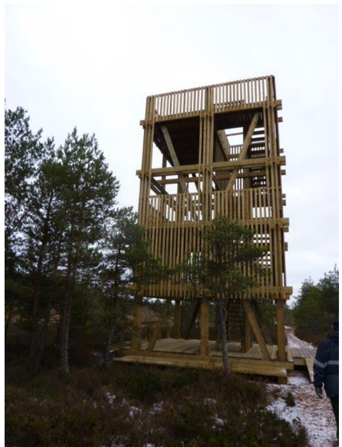
Koigi matkaraja vaateplatvorm