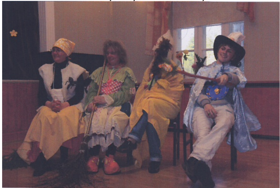
Auhinnaline II koht võistkonnale Aaviku