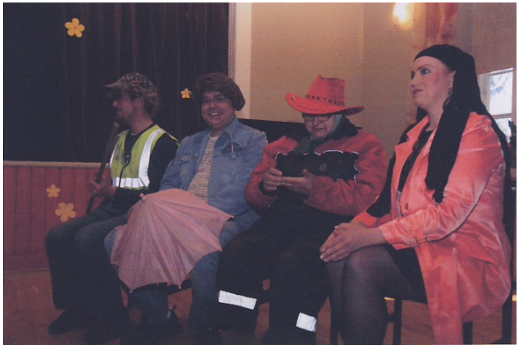
Võistkond Jurna: "Rooside sõja" IV koha omanikud