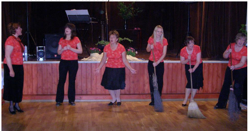
Naisansambel lauluhoos 23. mail KOKLULA-s