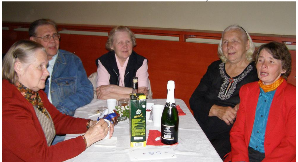
... ja pidulised 23. mail KOKLULA-s